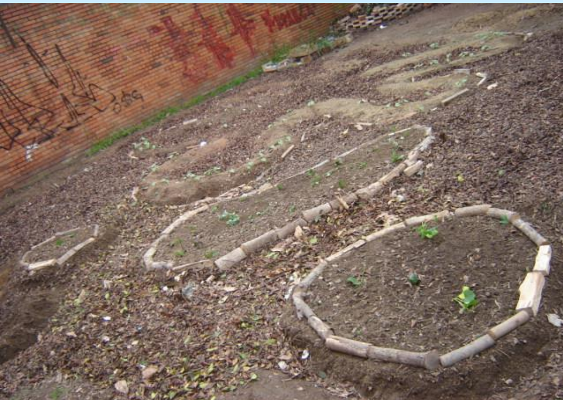
Primeiros canteiros, outubro 2007.