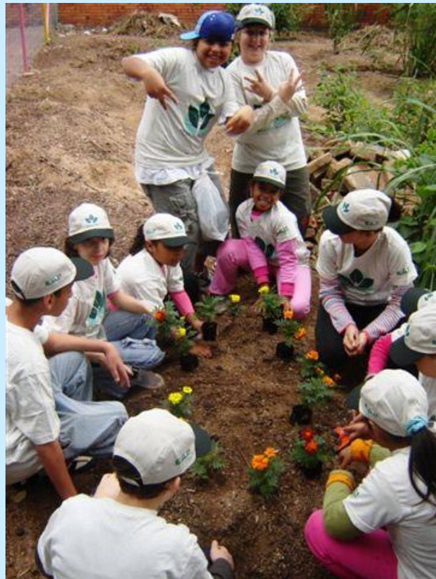
Plantio dos canteiros de produção, com cerca! maio 2008.