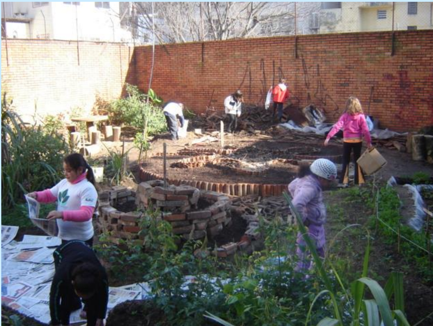
Construindo. Junho 2008.