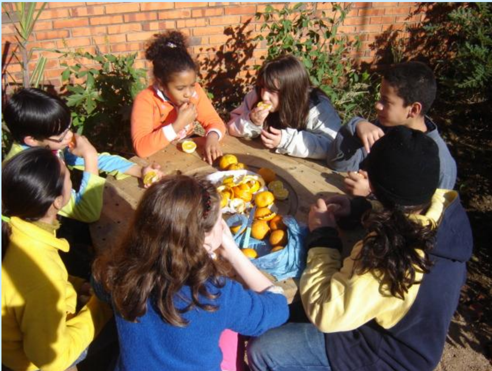
Mesa em uso, hora do lanche, laranjas orgânicas, maio 2008.