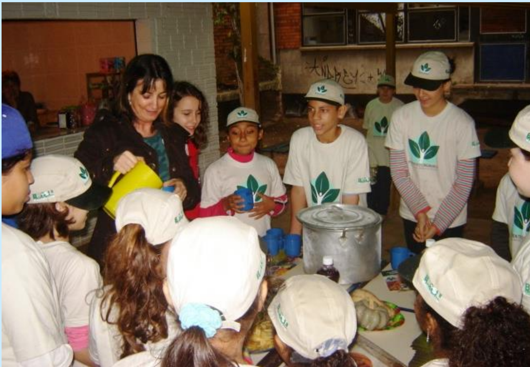
Degustação de alimentos orgânicos, durante IV Semana Dos Alimentos Orgânicos, Maio 2008.