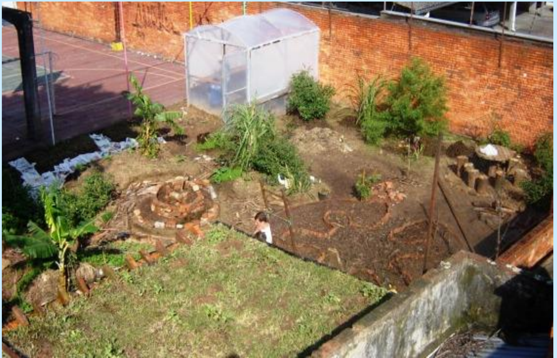
Vista aérea do Jardim Didático, junho 2008.