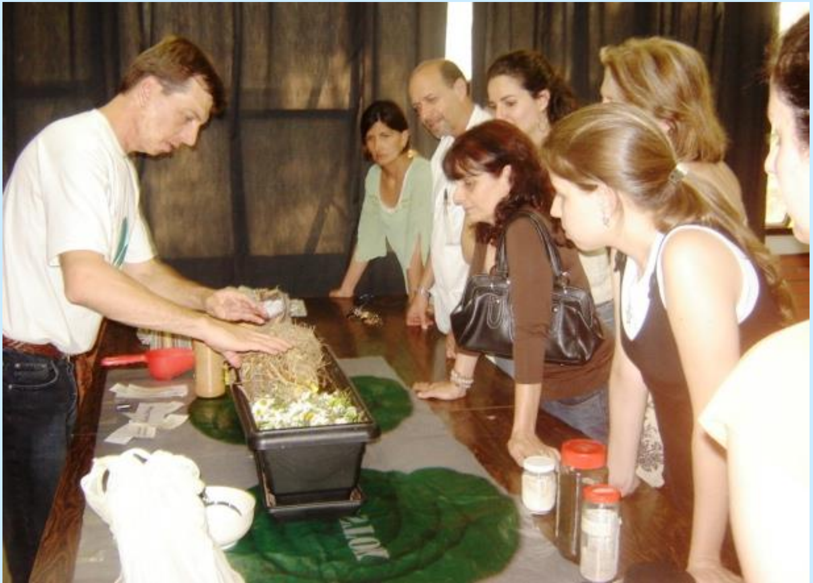
Oficina de compostagem para professores, outubro 2007.