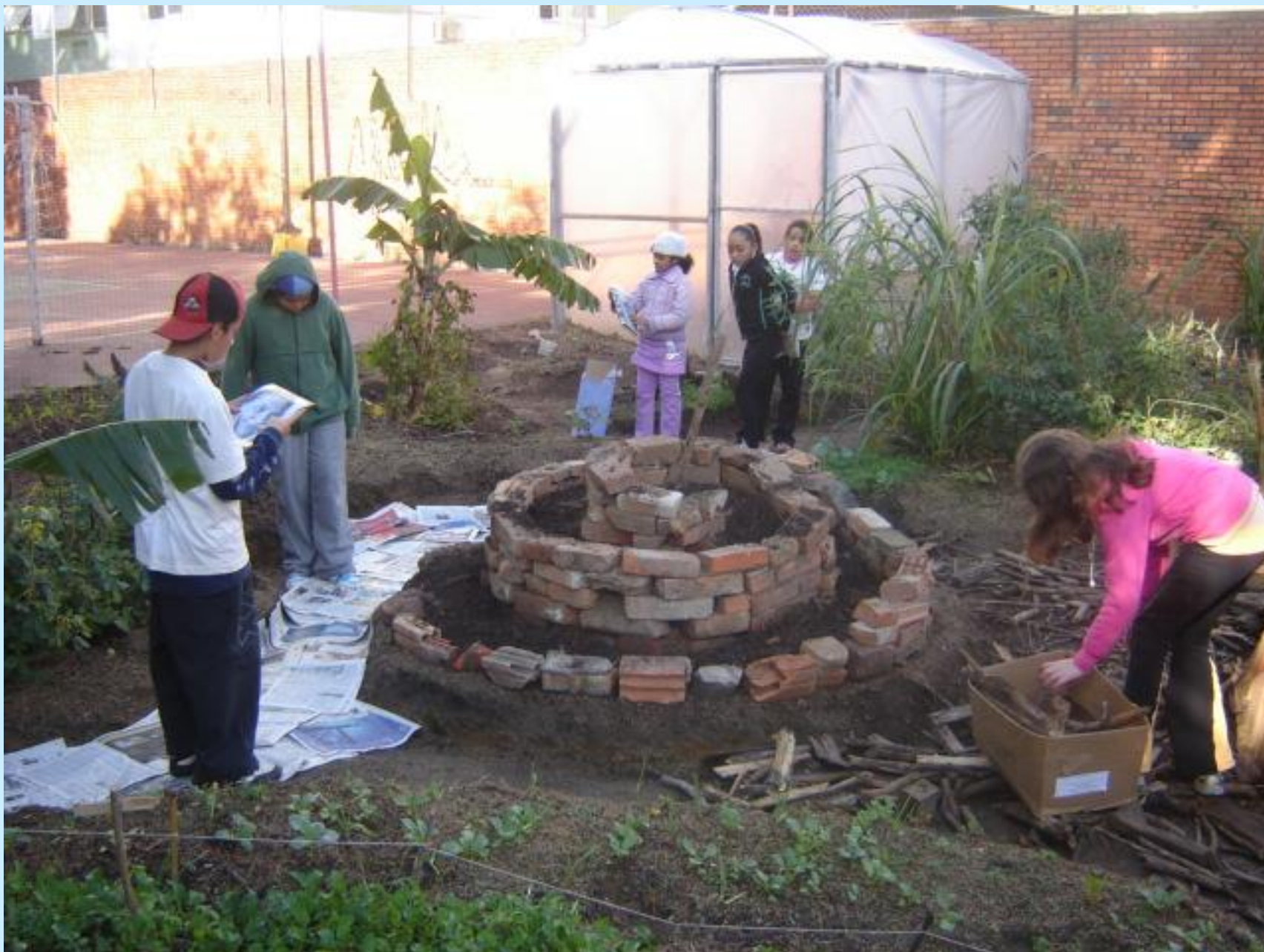
Construção do espiral do ervas, ao fundo a estufa, junho 2008,