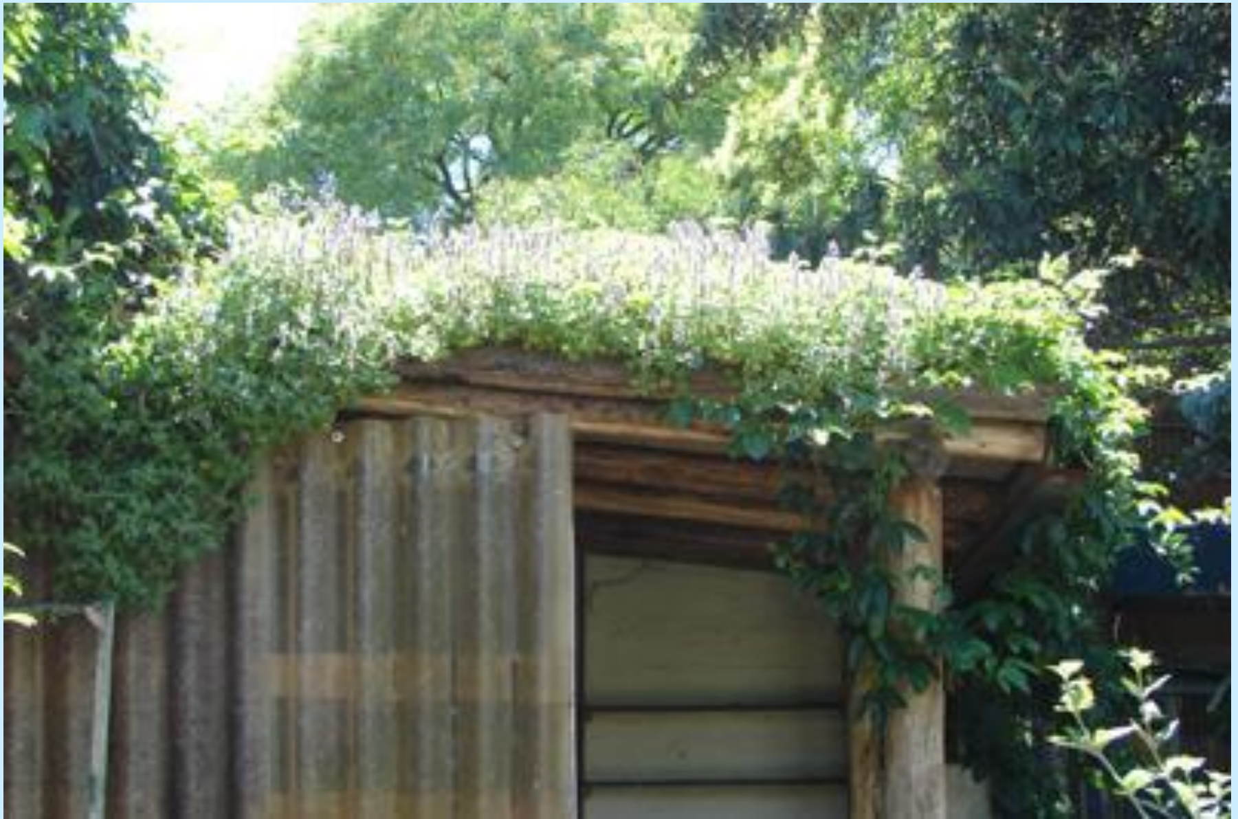
Telhado vivo: boldo – Novembro 2009