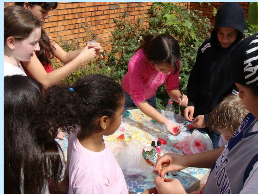
Oficina de sachet.