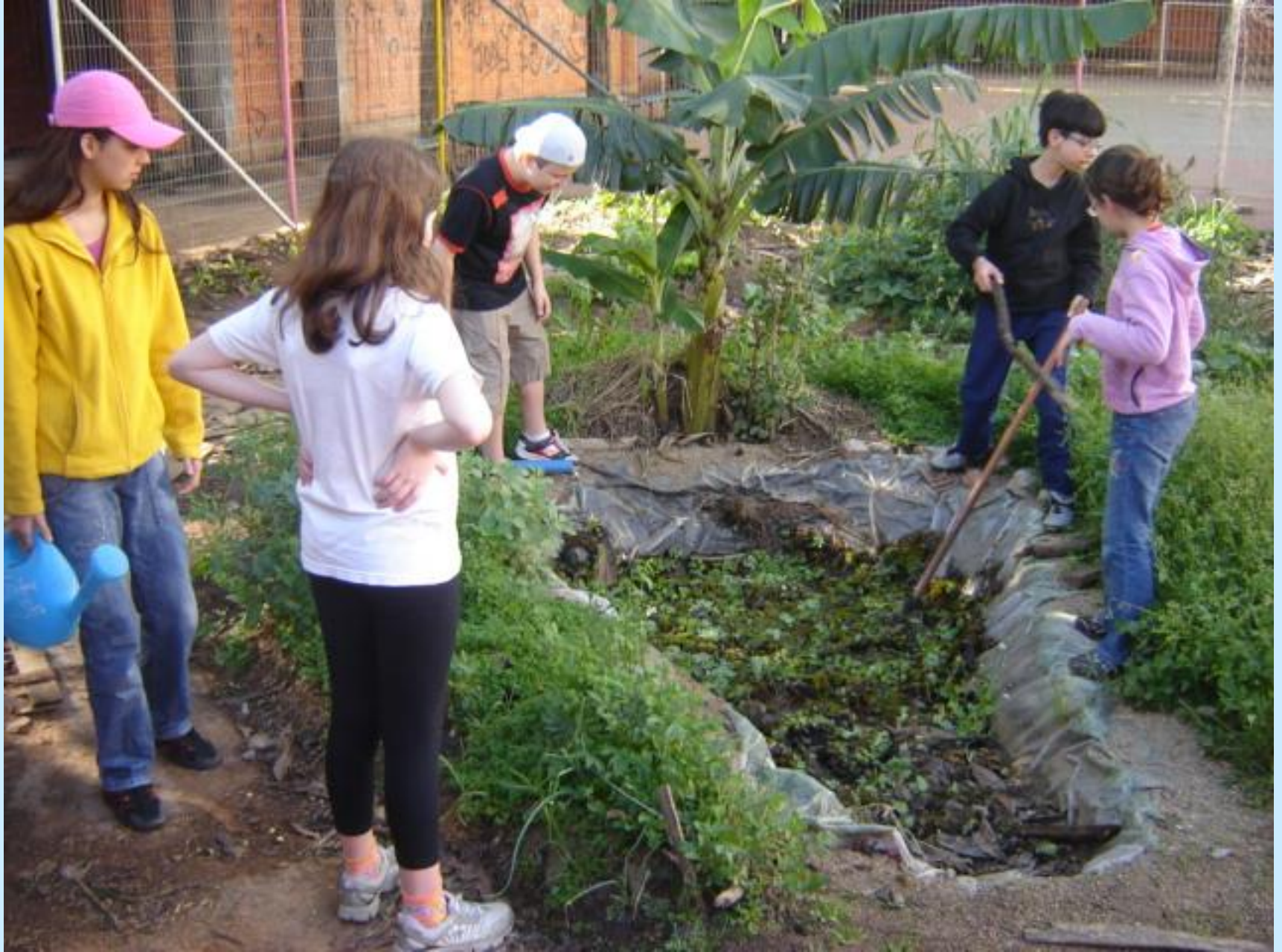
Lago da biodiversidade, setembro 2008.