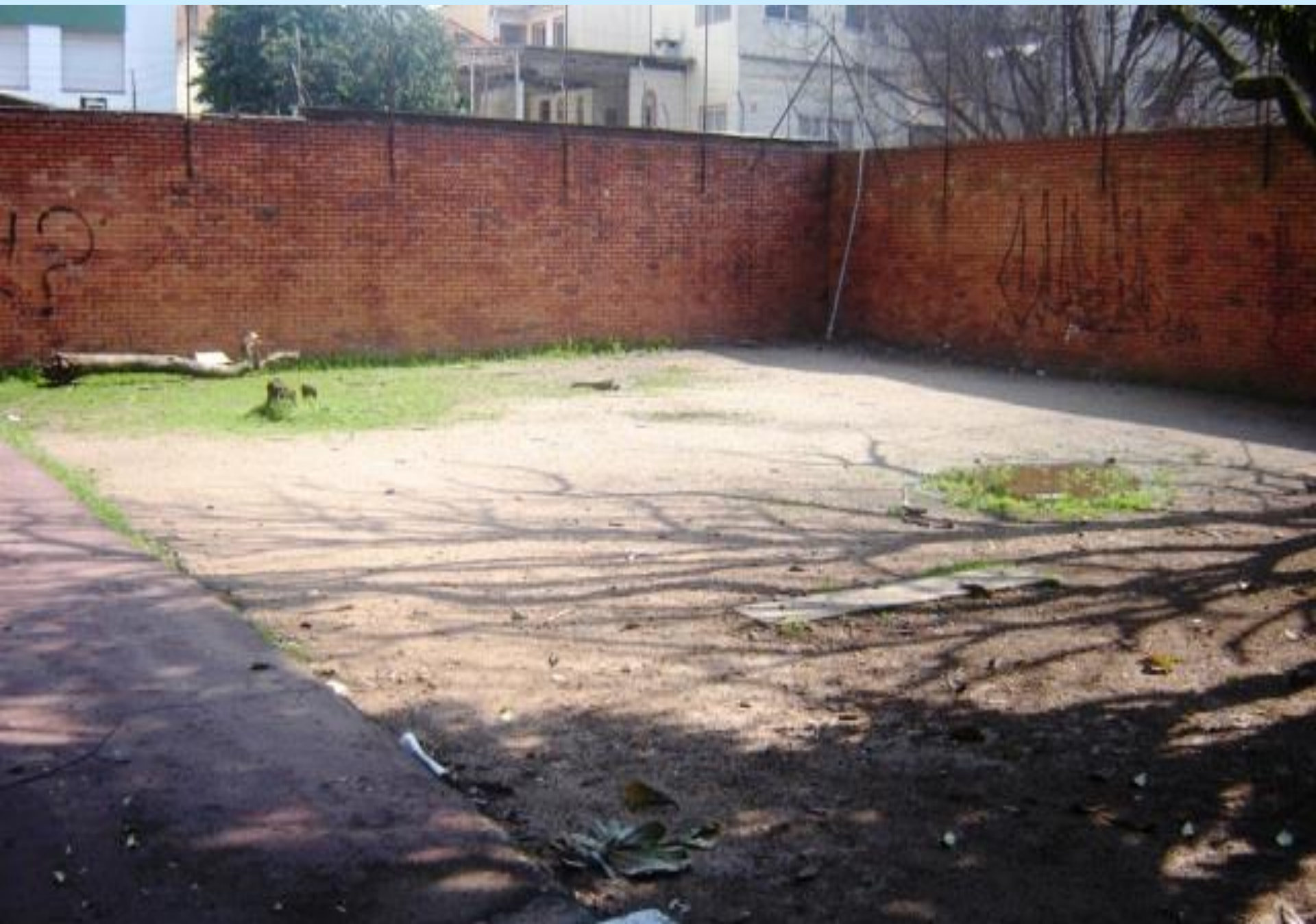
FOTO DA ÁREA - DIAGNÓSTICO EM 01.09.07