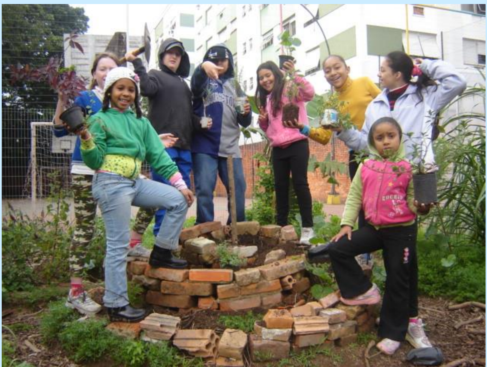
Plantio no espiral de ervas, mudas doadas pela Fundação Zoobotânica, agosto 2008.