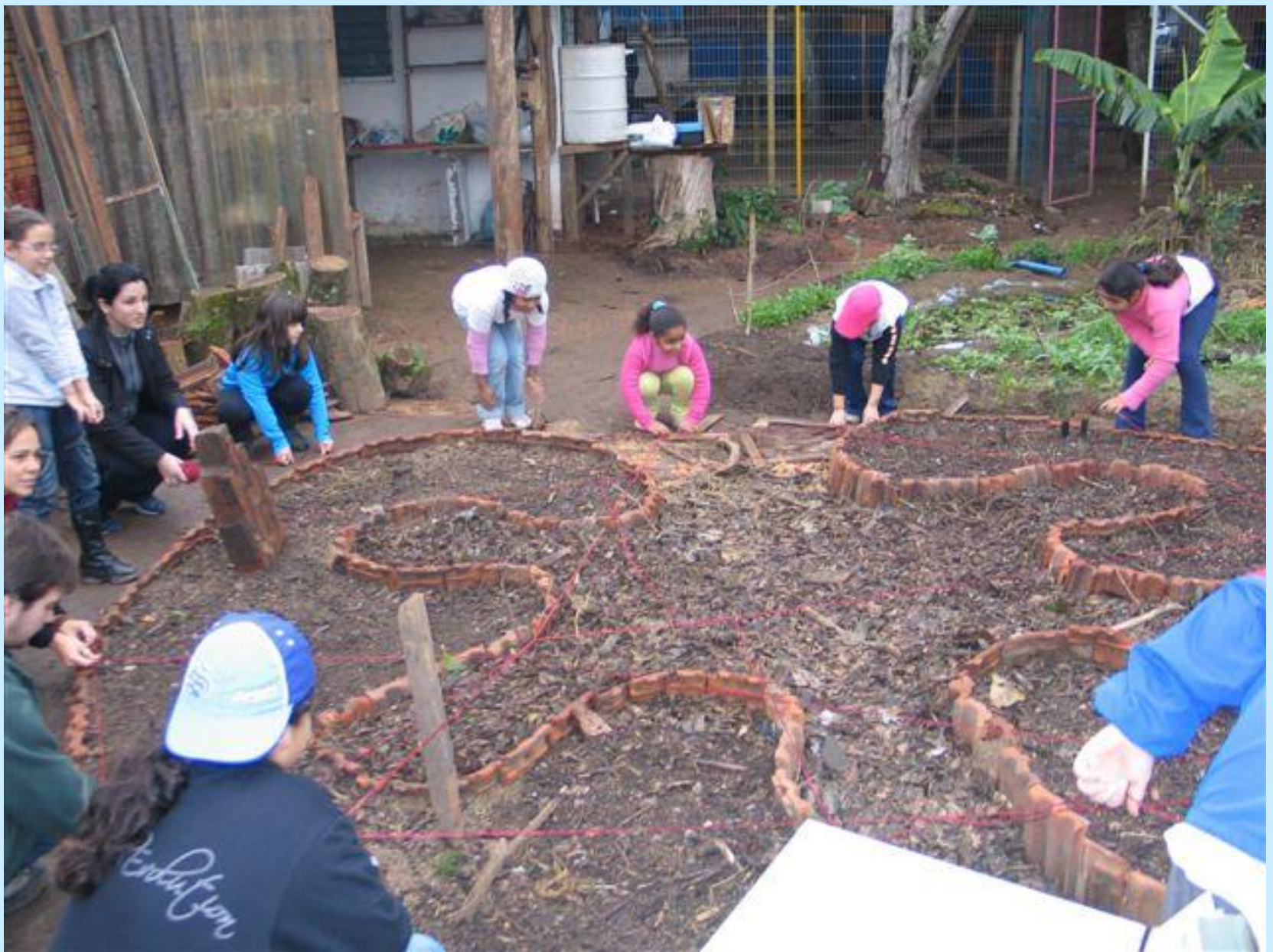
Mandala de plantas medicinais, junho 2008.