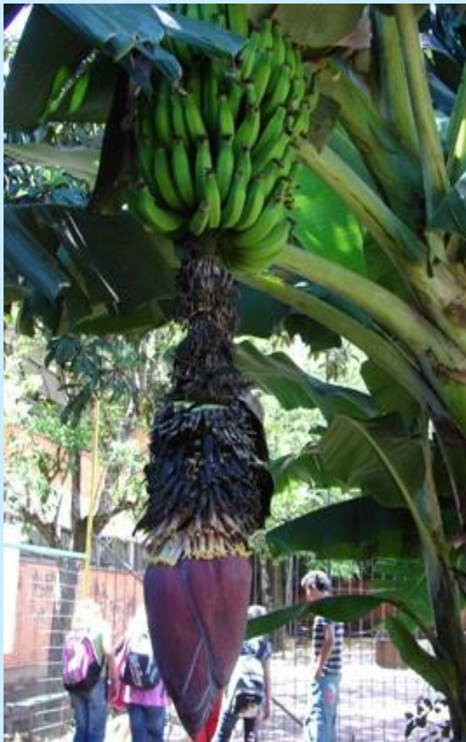
CACHO DE BANANA NO PÁTIO