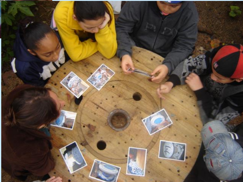
Oficina de mosaico com azulejos reciclados. Junho 2008.