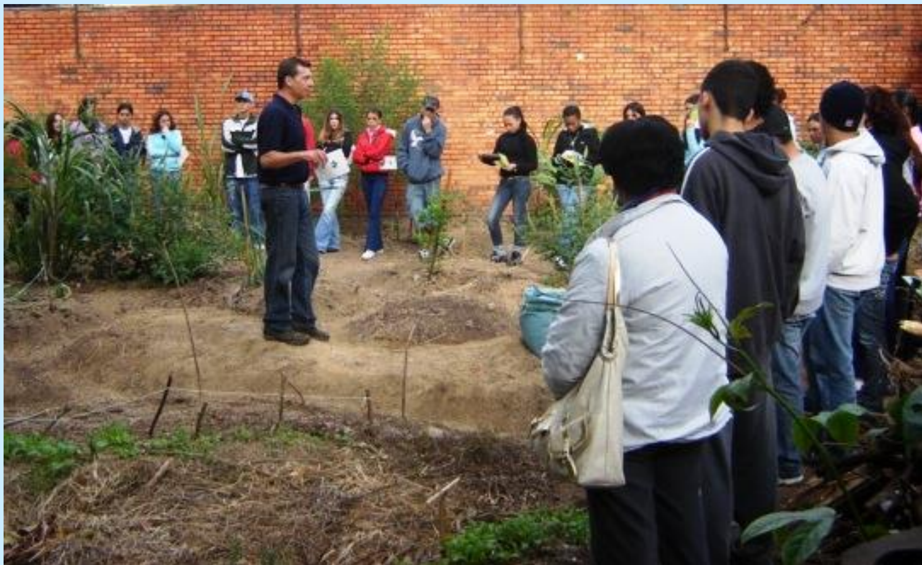
Apresentação do Projeto para as turmas e professores da Escola, em maio 2008.