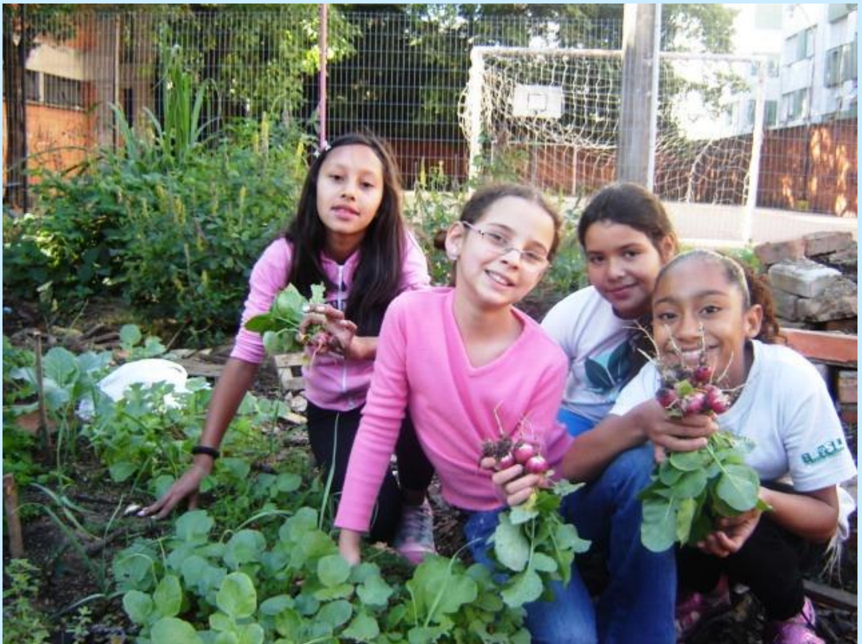
Produção rabanetes orgânicos, em julho 2008.